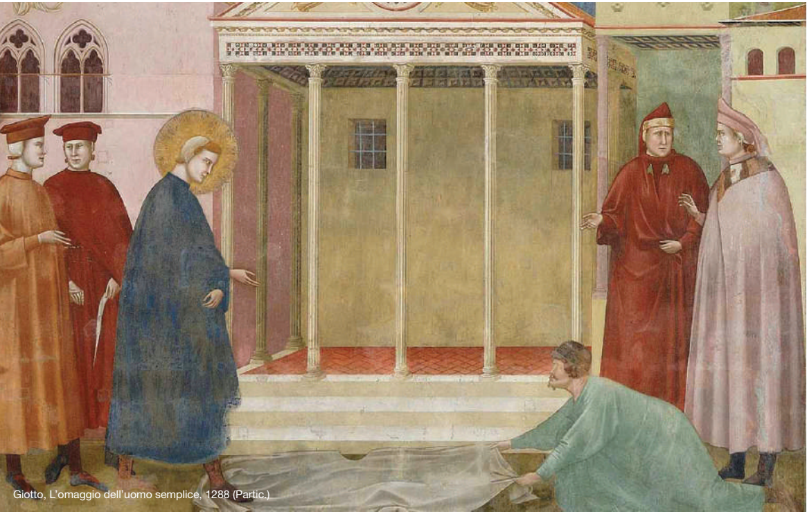
Giotto, L'omaggio dell'uomo semplice, 1288 (Partic.)

Accademia di Psicoterapia della Famiglia presente